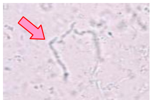
顕微鏡検査でみつけた白癬菌